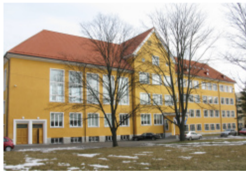
Kunstigümnaasiumi peafassaadil ja pliiatsi sümbolil on ühist nii vormi kui värvilahenduse osas.